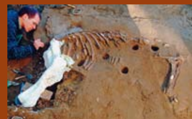
Romėnų karius lydėjo daugybė sunkiai apkrautų mulų.

Nuodugniau ištyrus paaiškėjo, kad tai – sumaišyti vyrų ir mulų kaulai. Matyt, kaulai ilgai voliojosi ant žemės, ant daugelio jų buvo matyti laukinių žvėrių dantų žymių. Paaiškinimą, kas nutiko, rasime antikos istoriko Tacito raštuose. Jis pasakoja, kad po šešerių metų, 15-aisiais, į mūšio lauką atvyko romėnų karvedys Germanikas ir, išvydęs išbarstytus romėnų kareivių palaikus, įsakė juos palaidoti. Įsakymą vykdę kariai nesugebėjo atskirti žmonių kaulų nuo gyvulių kaulų ir viską suvertė į bendrus didelius kapus.