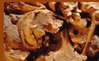
Prabėgus 6 m. po mūšio griaučiai buvo suversti į bendrus kapus.