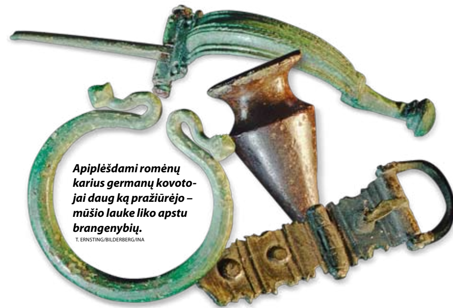
Apirplėdami romėnų karius germanų kovotojai daug ką pražiūrėjo – mūšio lauke liko apstu brangenbių.

Kasinėtojai romėnų ir germanų keramikos šukių rado tose pačiose vietose, vadinasi, šiame mieste romėnai gyveno drauge su germanais. Be to, archeologai nerado beveik jokių ginklų. Jie neabejoja, kad tai – seniausias žinomas romėnų